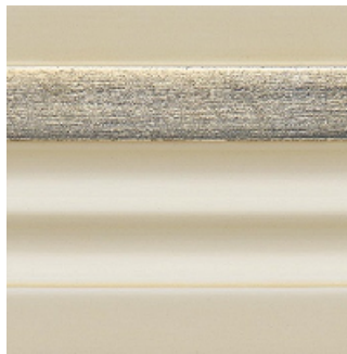
Bianco antico + foglia argento